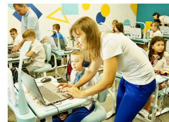
Цифрові освітні центри ЮНІСЕФ мають все необхідне для дистанційного навчання дітей