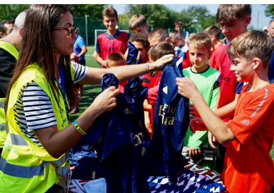
Іспанські благодійники передали подарунки для учасників юнацького футбольного турніру під егідою Real Madrid Foundation