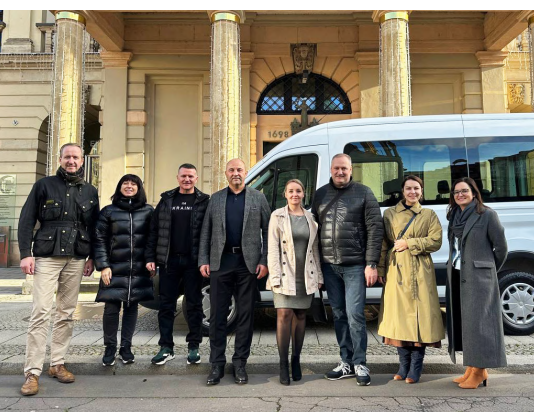
Робоча зустріч з партнерами в місті Магдебург після конференції муніципальних партнерств. Передача Ford Transit для запорізьких соцслужб

Уклінно дякуємо всім партнерам і благодійникам за допомогу і довіру. Сподіваємось, наша плідна співпраця триватиме надалі.