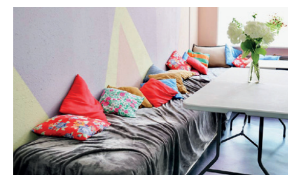
Одна з кімнат у шелтері "Сімейний центр", що створений ГО "Молодь нашого майбутнього" на базі приміщення з комунального фонду