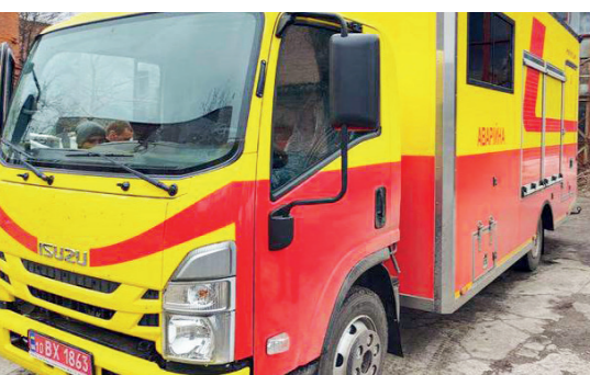
Три такі аварійні машини передані концерну "МТМ" в рамках Проєкту енергетичної безпеки за підтримки USAID