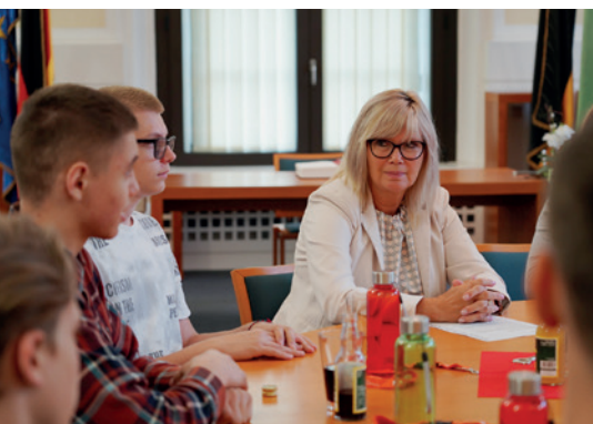
Зустріч запорізької дитячої делегації з очільницею Магдебурга, пані Сімонє Борріс